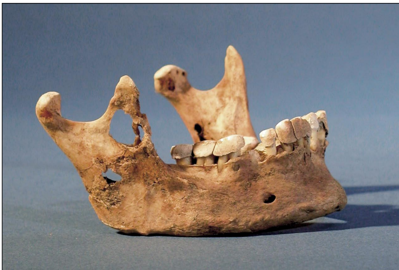
Mynd 4. hringlaga og allt að 5 mm í þvermál, nema þar sem tvær eða fleiri hafa sameinast. Brúnir þeirra eru mjög skarpar og ekki er að sjá nein merki um óeðlilega beinamyndun eða eyðingu umhverfis þær.