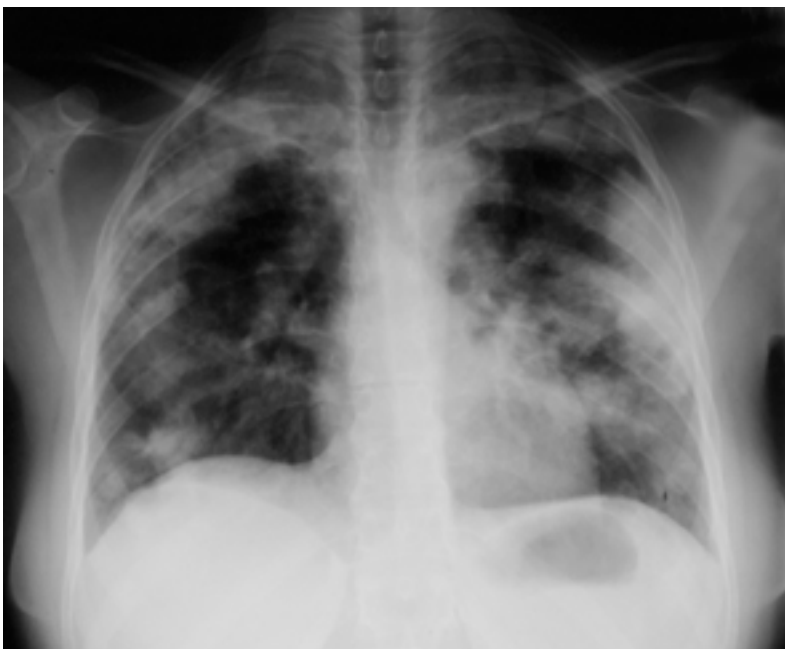
Mynd 1. Röntgenmynd af lungum hjá sjúklingi með langvinna eósínófila lungnabólgu og dægigerðar útlægar íferðir.

Langvinn eósínófil lungnabólga (LEL) er sjaldgæfur sjúkdómur og algengi er ekki vel þekkt. Hefur sjúkdómurinn verið talinn allt að 2,5% af millivefslungnasjúkdómum í hinum ýmsu skráðum (2-3). LEL getur komið fyrir í hvaða aldurshóp sem er, en er afskaplega sjaldgæf í börnum (4). Okkar rannsókn er sú fyrsta í heiminum sem