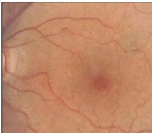
Mynd 1. Þriðja stigs makúlugat.

Makúlugat er fullþykktargat í miðgróf sjónhimnu (fovea eða foveolu) og var fyrst lýst af Knapp árið 1869 (1) (mynd 1). Ýmsar kenningar hafa verið um meinmyndun makúlugats en sú kenning sem hefur fengið hvað mest fylgi er að tog frá glerhlaupi augans valdi makúlugati, með eða án