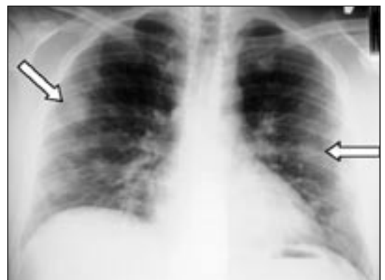
Mynd 1. Fjölmargar daufar allt að 3 cm stórar hringlaga þéttingar útlægt í báðum lungum.

Correspondence: Sigurður Heiðdal, sigurdurh@fsa.is