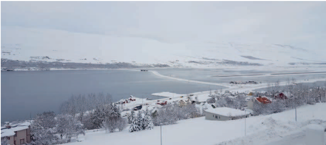
Útsýni af fæðingardeildinni.

Heilsugæslan á Dalvík, Heilbrigðisstofnunin á Sauðárkróki, Heilbrigðisstofnunin á Blönduósi og Fjallabyggð. Flatarmál þessa þjónustusvæðis er stórt og nær frá Blönduósi í vestri til Þórsafnar í austri og á þessu svæði búa um 35.000 manns og eru starfsmenn 500. Ljós-mæðraþjónusta er í boði á öllum starfstöðum, sú þjónusta er unnin í samvinnu við heimilislækna og fæðingarlækna á sjúkrahúsinu á Akureyri, ef þörf er á (Heilbrigðisstofnun Norðurlands, e.d.).