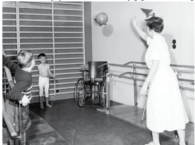
SJÚKRAPJÁLFUN Á SJAFNARGÖTU 14

Þegar leikskólinn Múlaborg var byggður í næsta nágrenni við Æfingastöðina samdi félagið við Sumargjöf, sem sá um rekstur dagheimila borgarinnar, um að fjórðungur dagvistarrýmanna yrði ætlaður fötluðum börnum. Samið var um að borgin legði fram húsnæði og aðstöðu, en Styrktarfélagið starfsfólk og nauðsynleg hjálpartæki. Þarna varð mjög góð samvinna og