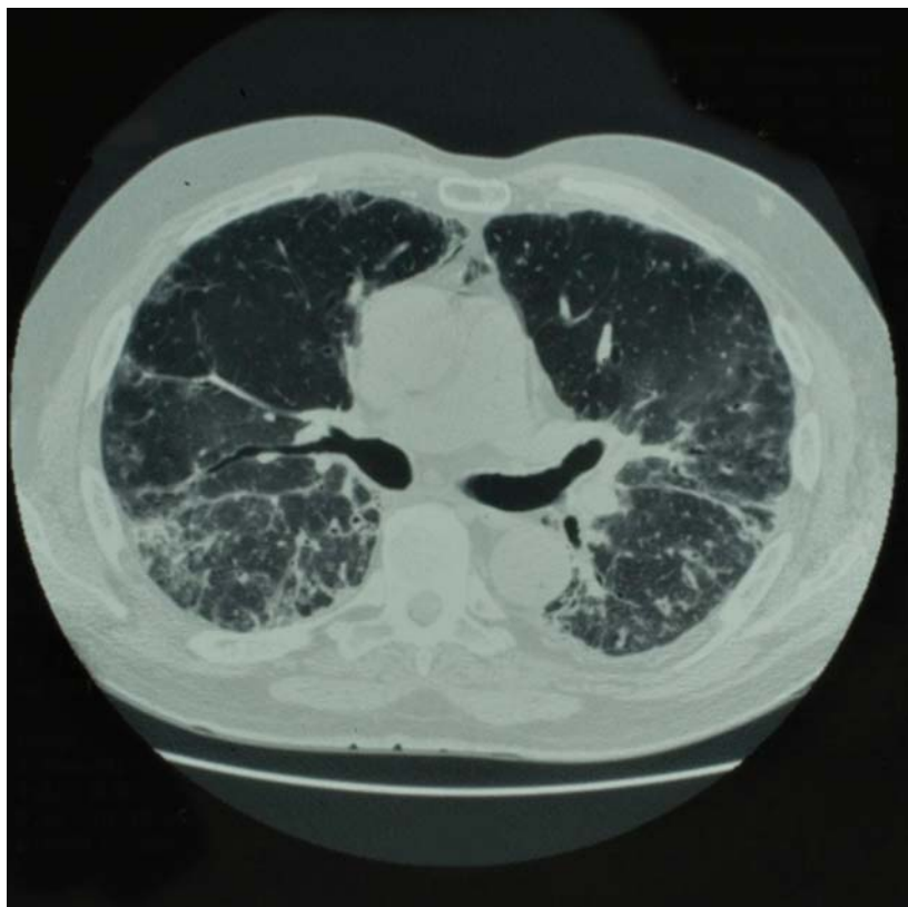
Mynd 1. Tölvusneiðmynd sem sýnir hélubreytingar (ground glass) og þéttingar í báðum lungum.

frá læknaþofum um sjúklinga sem greindir höfðu verið með trefjavefslungnaþólgu. Í rannsóknina voru eingöngu teknir sjúklingar sem höfðu vefjasýni til staðfestingar sjúkdómsgreiningu. Trefjavefslungnaþólga var talin vera orsökun af amíóðarón ef sjúklingur var að taka lyfið á sama tíma og sjúkdómurinn var greindur og ástand sjúklings batnaði við það að hætta gjöf lyfsins. Öll vefjasýni voru yfirfarin af meinafræðingi (HJÍ) og stuðst við alþjóðleg skilmerki til að ganga úr skugga um að trefjavefslungnaþólgu væri að ræða en ekki aðra sjúkdóma. Fengin voru leyfi frá Vísindasíðanefnd og Persónuvernd fyrir rannsókninni auk leyfa yfirlækna sjúkraþofnana.